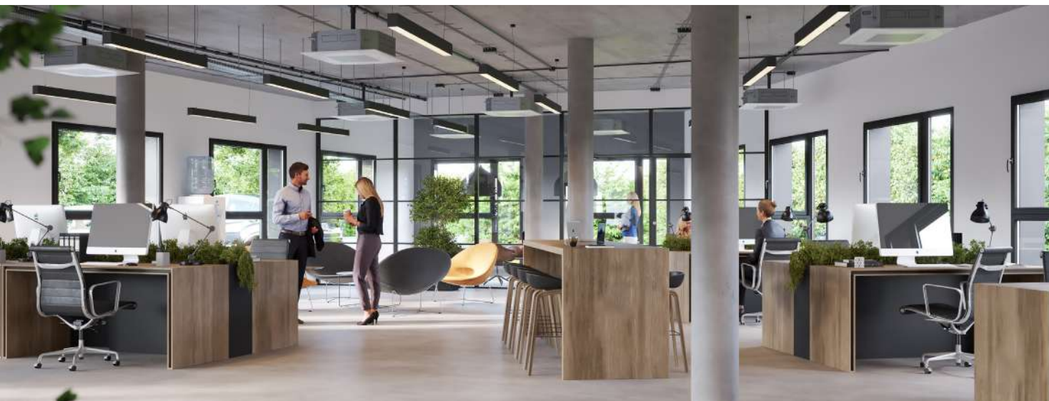
Des espaces de travail exclusifs, performants et lumineux.