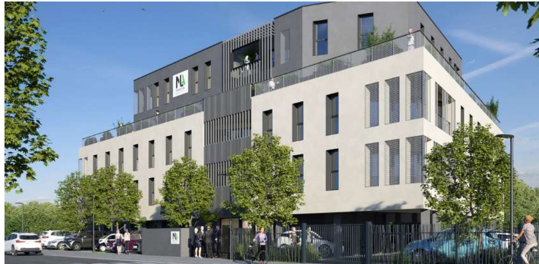
Nous vous proposons un immeuble de bureaux au coeur de l'agglomération rouennaise.