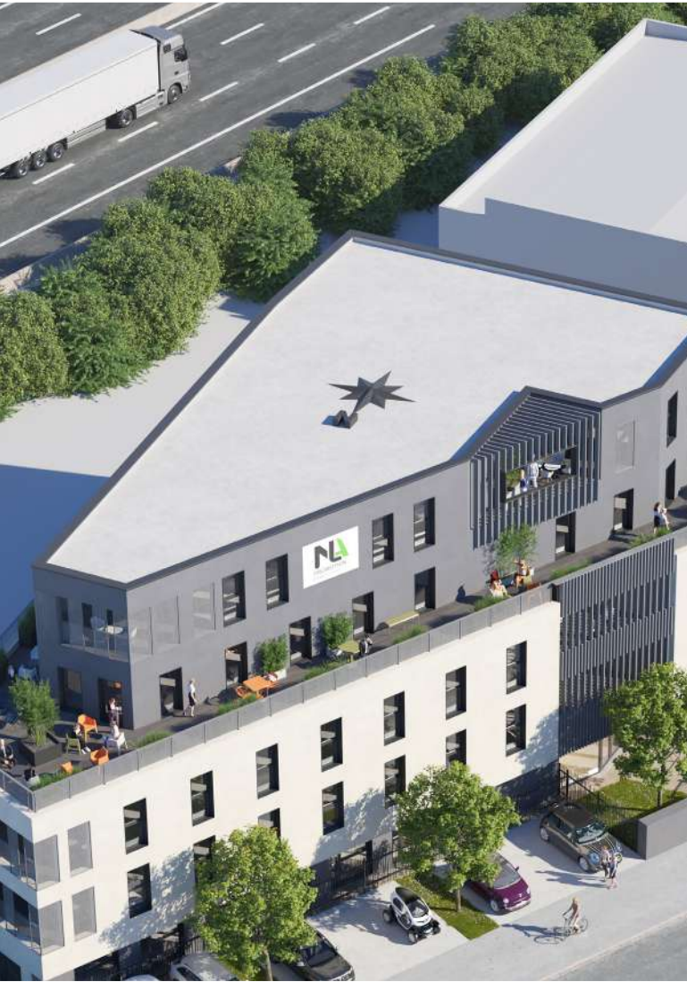
La Rose, une implantation idéale, au pied de la Sud III.