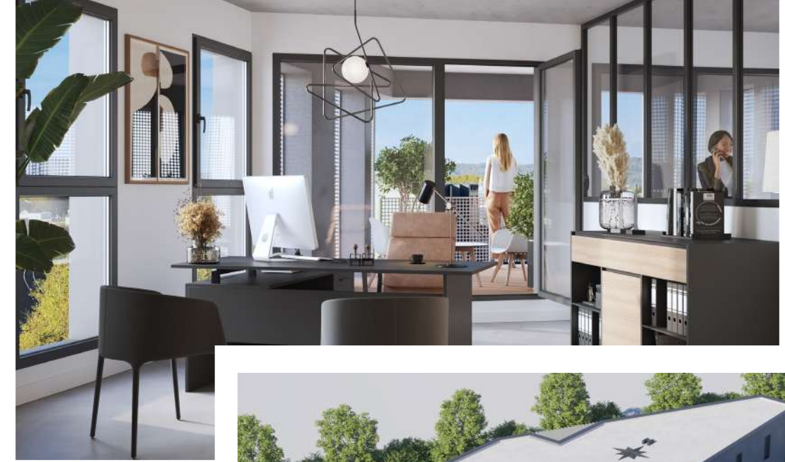
Des espaces de bureaux individuels et lumineux.