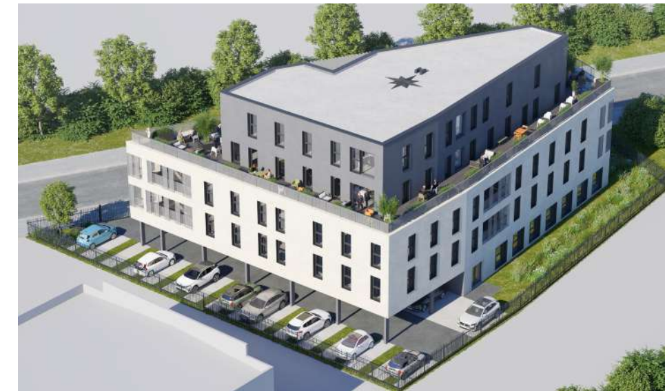
La terrasse spacieuse offre une vue panoramique et dégagée sur Grand-Quevilly.